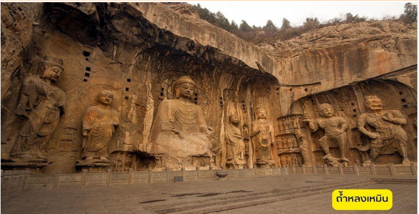
ถ้ำหลงเหมิน

ศาลเจ้ากวนอู – ถ้ำหลงเหมิน - นั่งรถไฟสู่เมืองซีอาน - กำแพงเมืองซีอาน – หอระฆัง - ถนนคนเดินมุสลิม