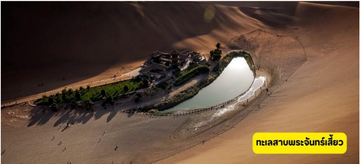
ทะเลสาบพระจันทร์เสี้ยว