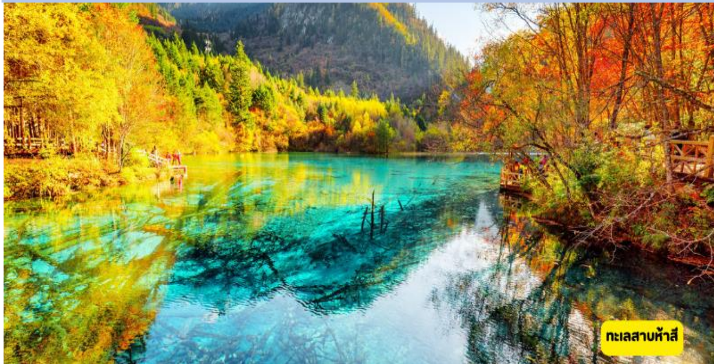
ทะเลสาบห้าสี

เช้า ๑๐ | รับประทานอาหารเช้า ณ ห้องอาหารโรงแรม นำท่านสัมผัสธรรมชาติภายใน “จิวจ้ายโกว” โดยรถอุทยาน ให้ท่านได้ชมธรรมชาติบริสุทธิ์ที่ได้รับการดูแลรักษาไว้เป็นอย่างดีโดยไม่ถูกทำลายด้วยน้ำมือมนุษย์ ชมความงามของ ทะเลสาบแรด ทะเลสาบมังกรหลับ ทะเลสาบชูเจิง น้ำตกชูเจิง ทุกสถานที่ล้วนเป็นความงามที่ธรรมชาติ ได้บรรจงสร้างไว้ได้ดั่งภาพที่จินตนาการไว้ ของเหล่านักกวีทั้งหลาย นำท่านชม ทะเลสาบเสือ ทะเลสาบแพนด้า ทะเลสาบไฝลูกศร ทะเลสาบฤดูกาล ชมสีสันของน้ำที่สะท้อนภาพของภูเขาท้องฟ้าสีคราม ป่าดงดิบอันอุดมสมบูรณ์ รวมทั้งเมื่อยามแสงอาทิตย์สาดส่องล้วนมีส่วนทำให้ จิวจ้ายโกว เป็นเหมือนดั่งดินแดนในฝันของนักเดินทาง