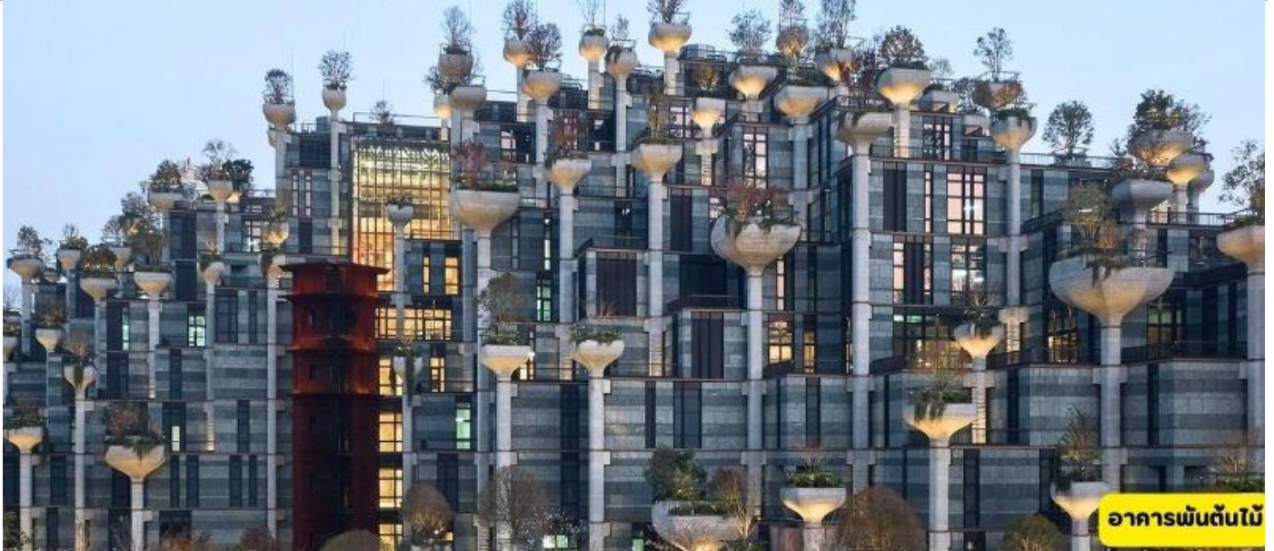
อาคารพันต้นไม้

** หากต้องการไปดิสนีย์แลนด์ เพิ่ม 3,000 บาท/ท่าน**