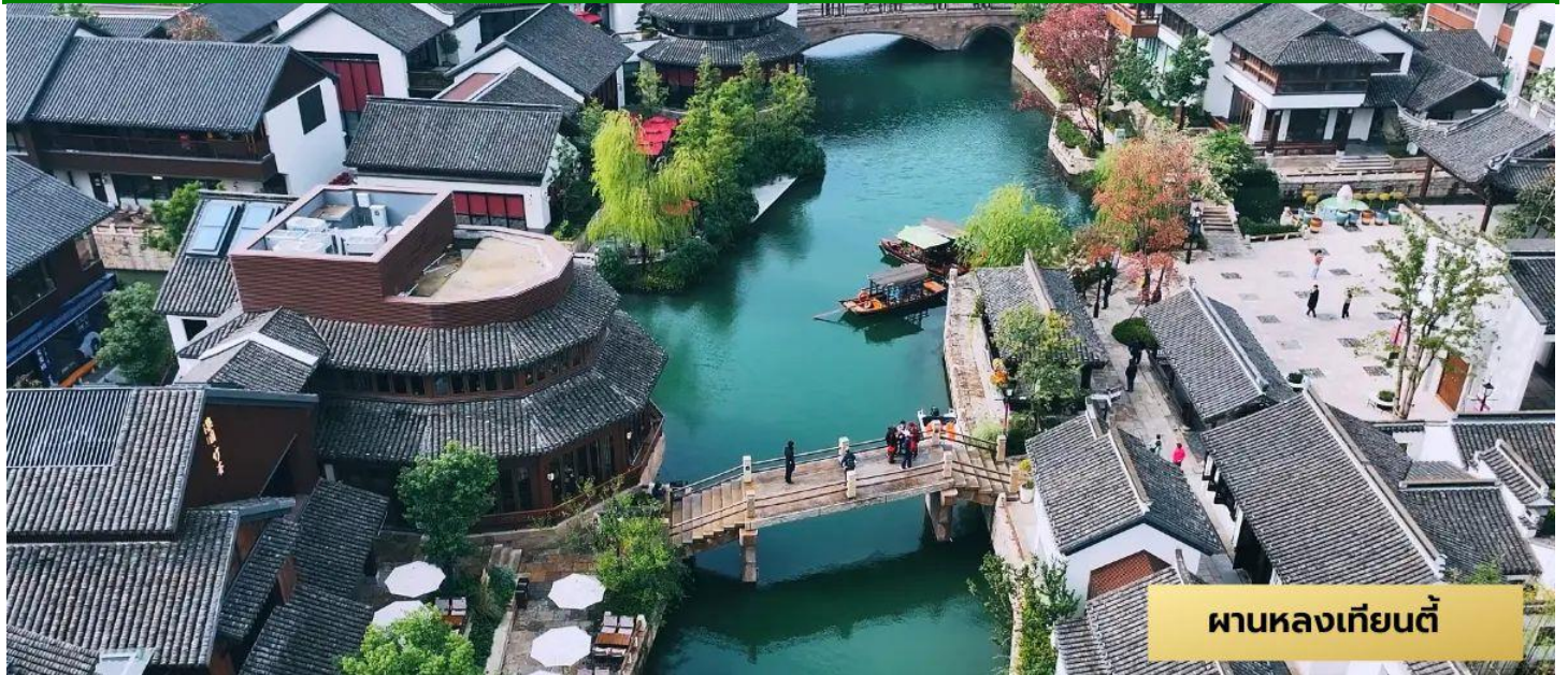
ผานหลงเทียนตี้

ถนนคนเดินเสี่ยวเหอเจีย - นครเซี่ยงไฮ้ - ผานหลงเทียนตี้