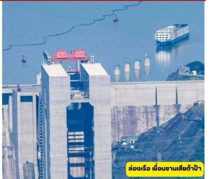
ล่องเรือ เมืองชานเสี่ยต้าป้า

เช้า 🍷 รับประทานอาหารเช้า ณ ห้องอาหารโรงแรม