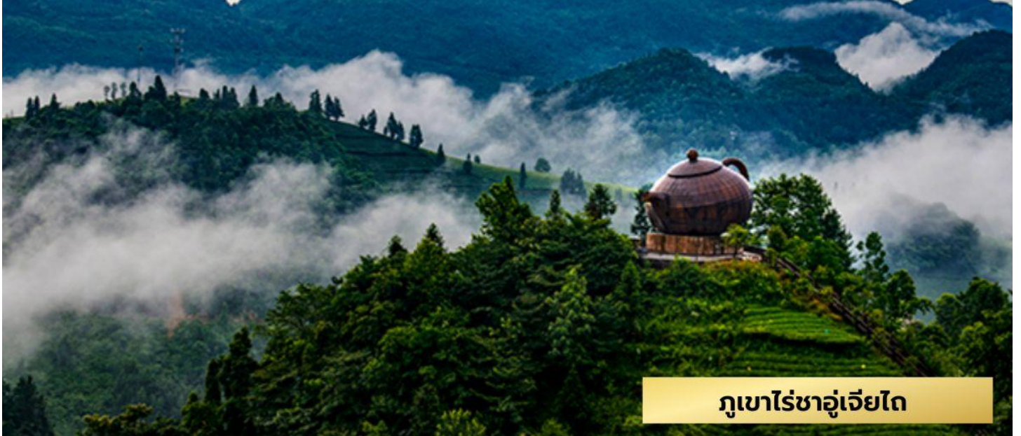
ภูเขาไร่ชาอู๋เจียไถ

ภูเขาไร่ชาอู๋เจียไถ - ป่าหินโชนลิน - ชมแสงสียามราตรีเมืองโบราณเซียนเอิน - ล่องเรือชมเมืองเซียนเอิน