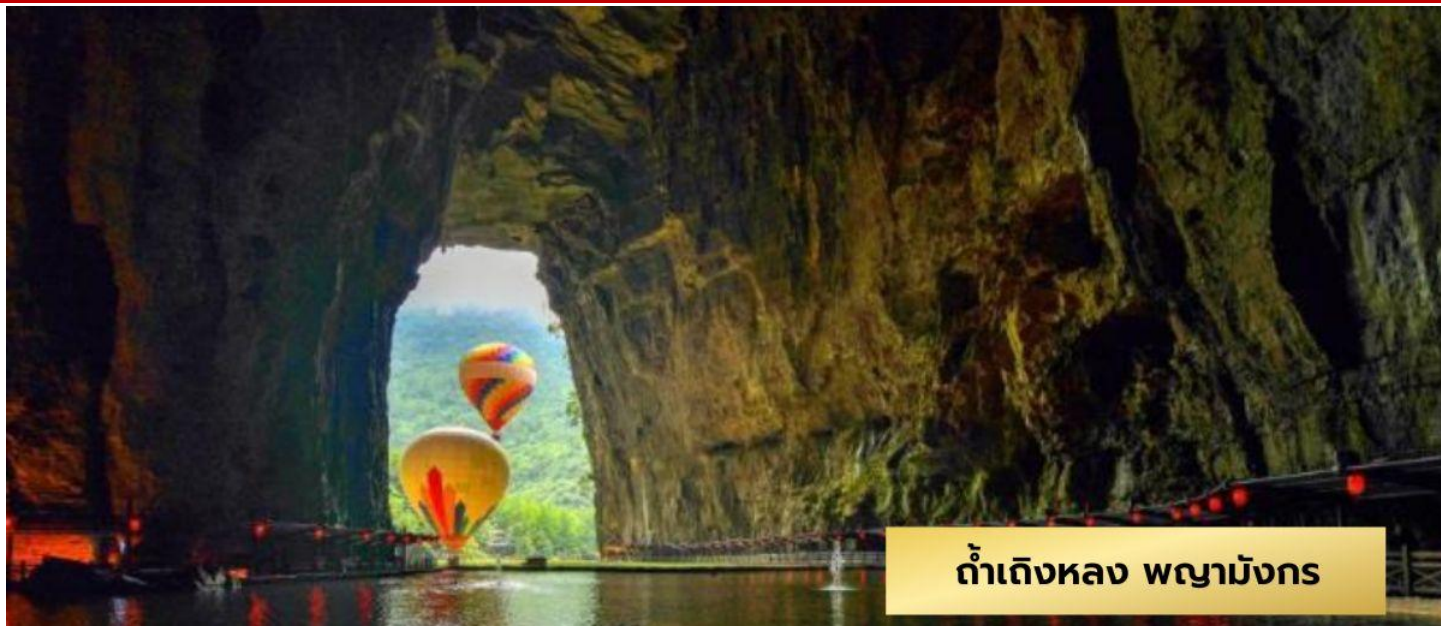
ถ้ำแดงหลวง พญามังกร

ถ้ำพญามังกร(รวมรถ+โชว์การแสดงพื้นเมือง) – เมืองเทพริดา – ชมวิวเมืองเทพริดา