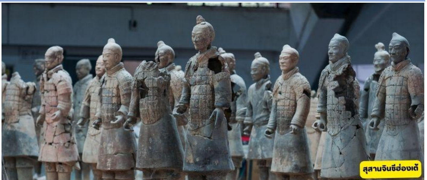
สุสานจินซีฮ่องเต้

ลั่วหยาง - ซื่ออัน นั่งรถไฟความเร็วสูง - สุสานจินซีฮ่องเต้ - ถ่ายรูปด้านนอกเจดีย์ห่านป่าใหญ่ - ถนนคนเดินต้าถงเมืองไม่หลับไหล