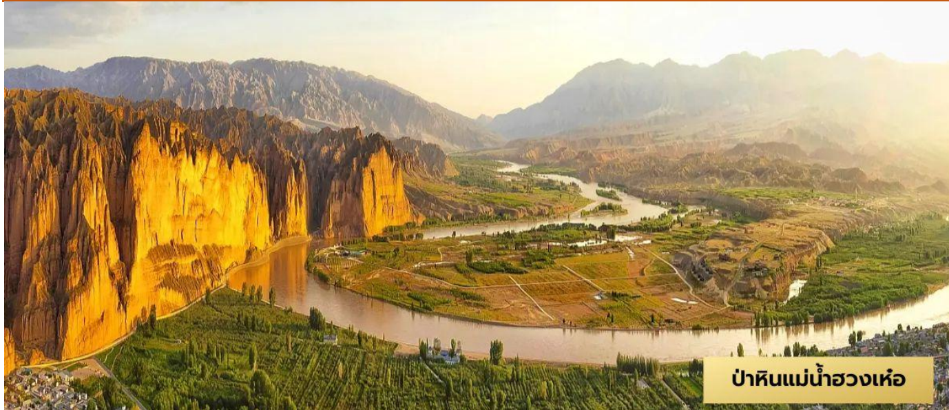
ป่าหินแม่น้ำฮวงเหอ

เมืองหลานโจว – เมืองจิงไท่ - ป่าหินแม่น้ำฮวงเหอ(ล่องเรือ) – เมืองอู๋เหว่ย