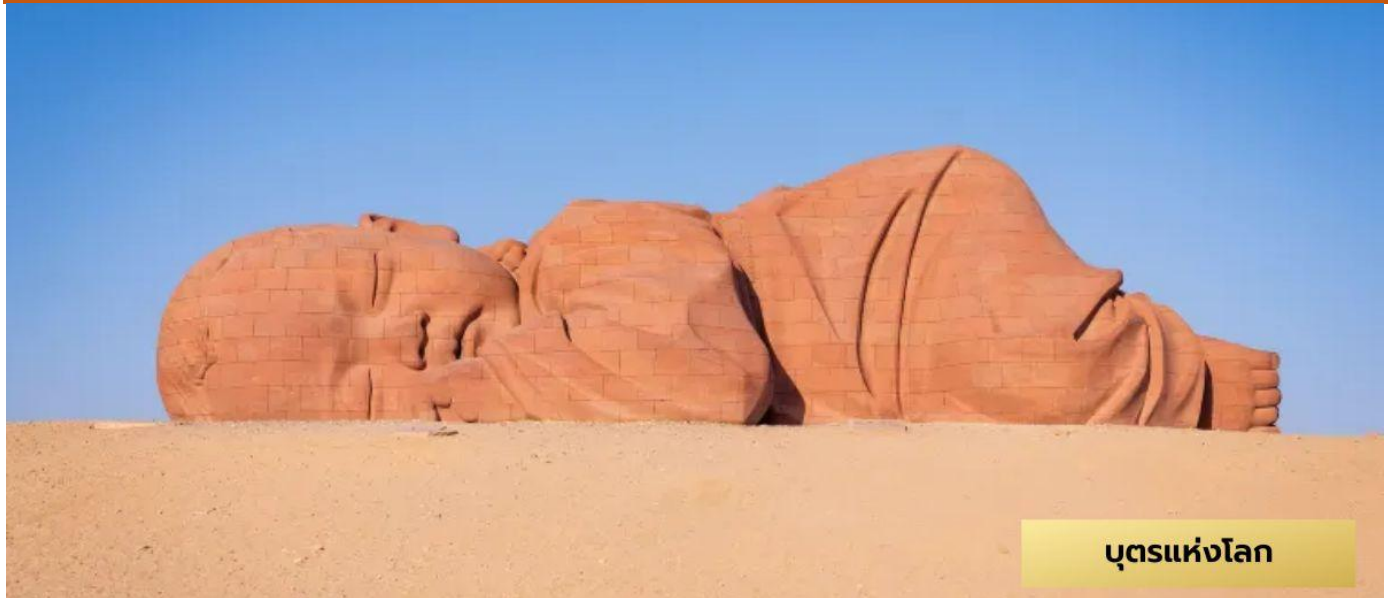
บุตรแห่งโลก

เมืองกวาโจว – บุตรแห่งโลก - ทะเลทรายหมิงซาซาน(รวมจี๋อูฐ)-ทะเลสาบพระจันทร์เสี้ยว