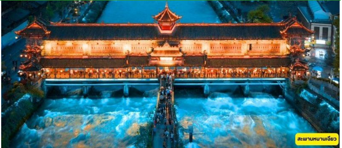
สะพานหนานเจียว

กรุงเทพฯ สุวรรณภูมิ - จีนตู - เมืองตูเจียงเยียน - สะพานหนานเจียว TG618 10.55 – 15.05 น.