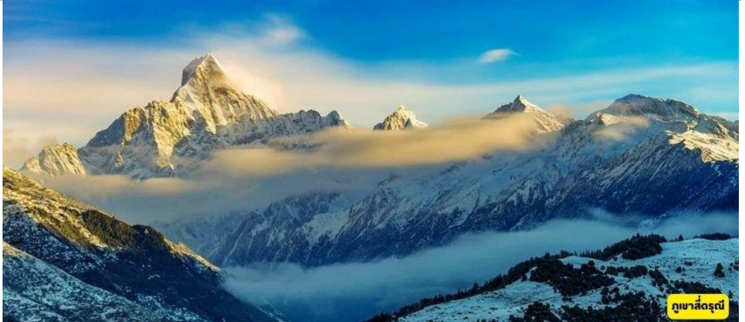
ภูเขาสี่ครุณี

เมืองตูเจียงเยียน - อุทยานภูเขาสี่ครุณี - ชวงเฉียวโกว