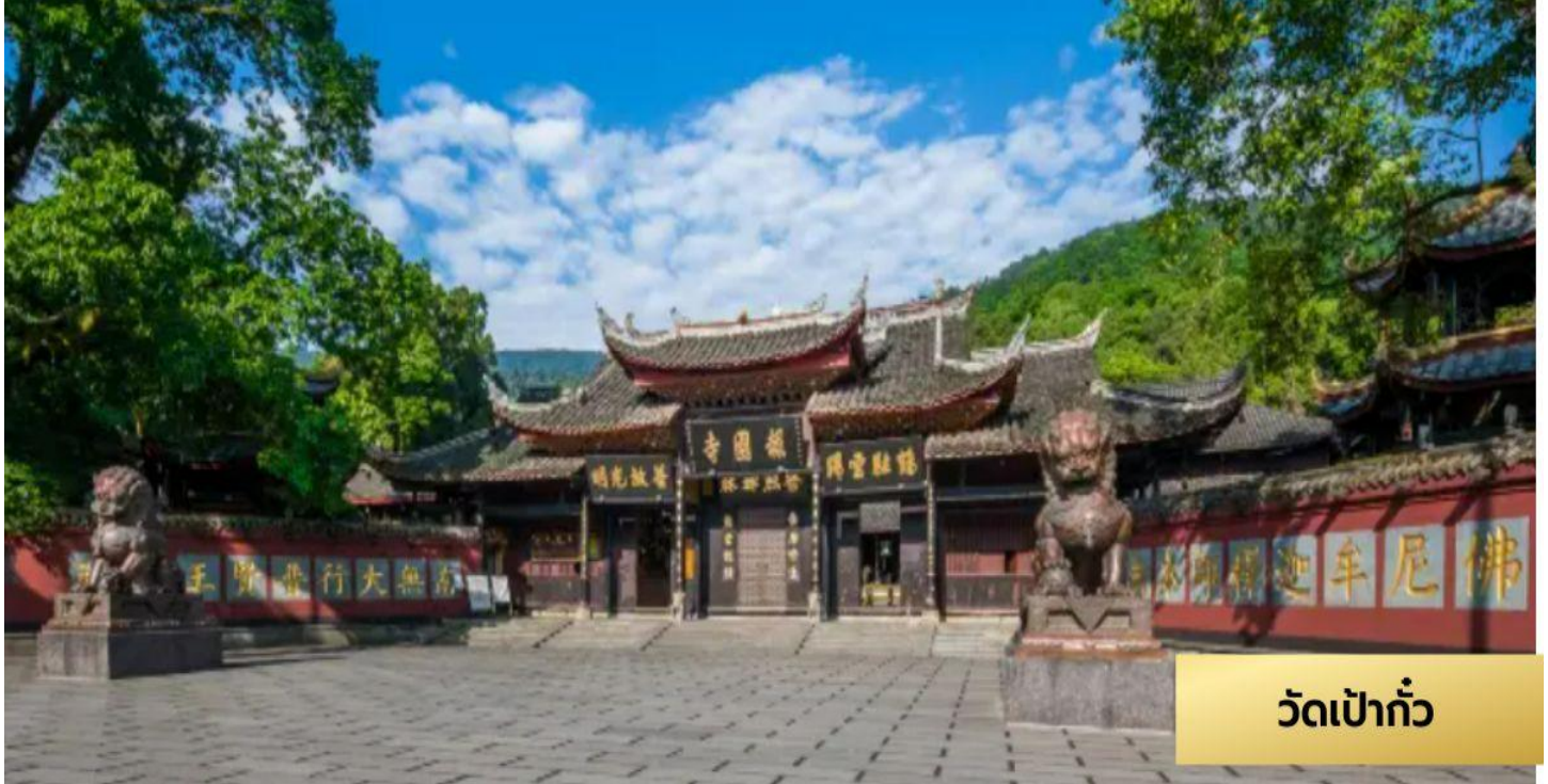
วัดเป้ากั้ว

เช้า ๑๐ รับประทานอาหารเช้า ณ ห้องอาหารโรงแรม หลังอาหารเช้า นำท่านเดินทางสู่ ง้อไ้ อีสระให้ท่านพักผ่อนตามอัธยาศัย