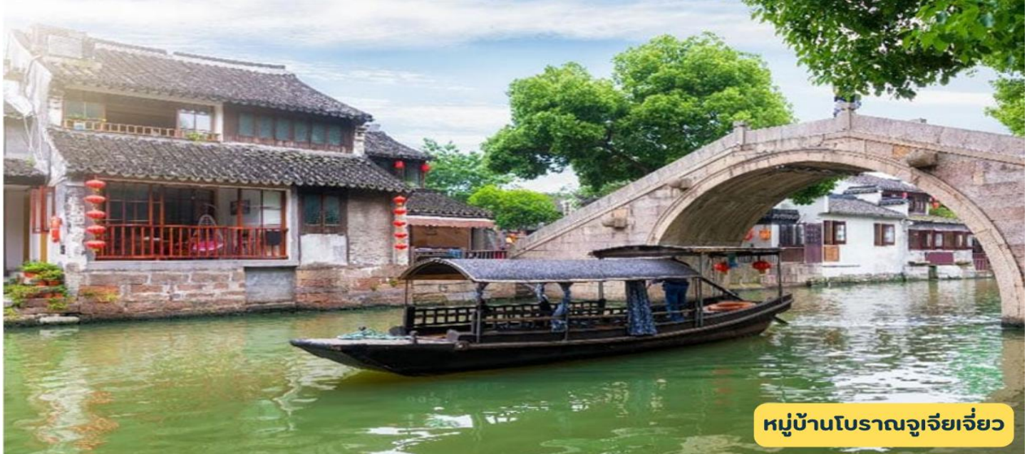
หมู่บ้านโบราณจูเจียเจี้ยว