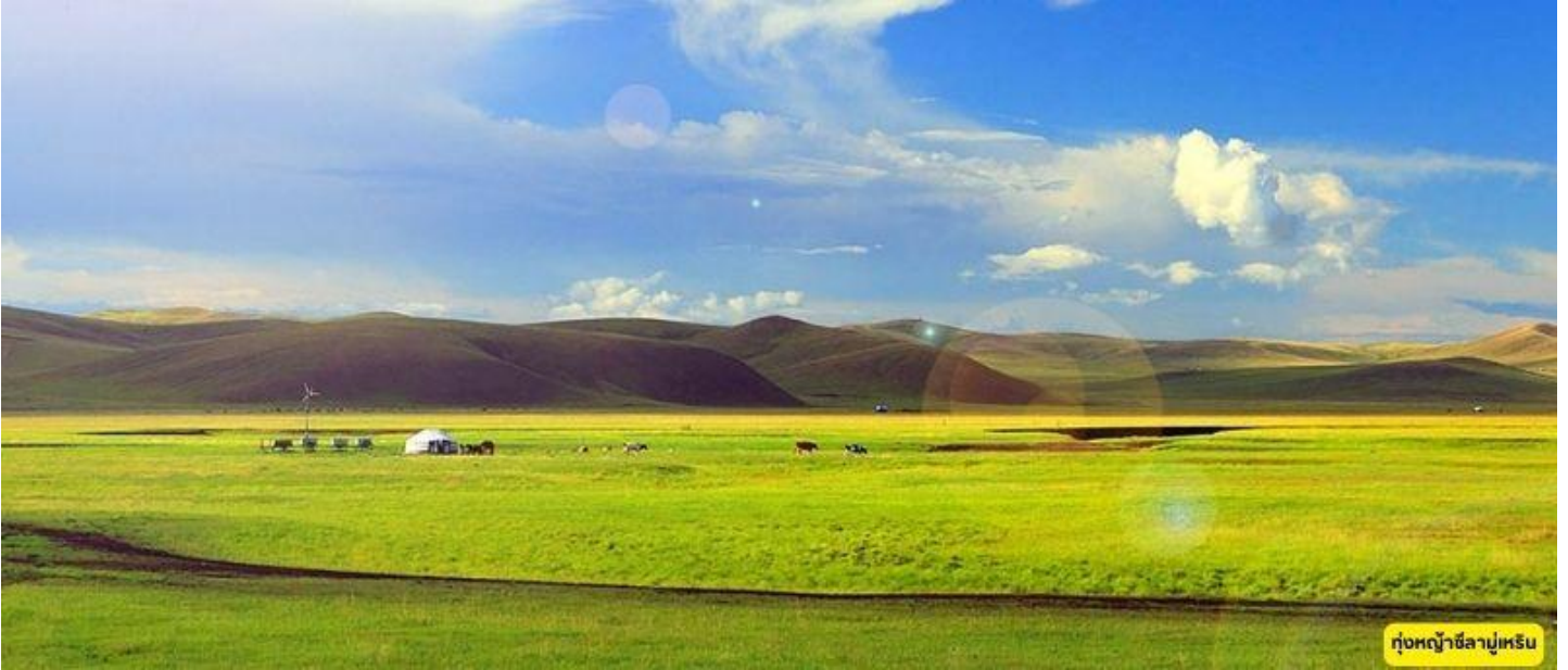
ทุ่งหญ้าซีลามูเหริน

พิพิธภัณฑท์หวังเจาจุน – ทุ่งหญ้าซีลามูเหรินชมโชว์ (รวมค่าใช้จ่ายชมโชว์จี้ม้า)