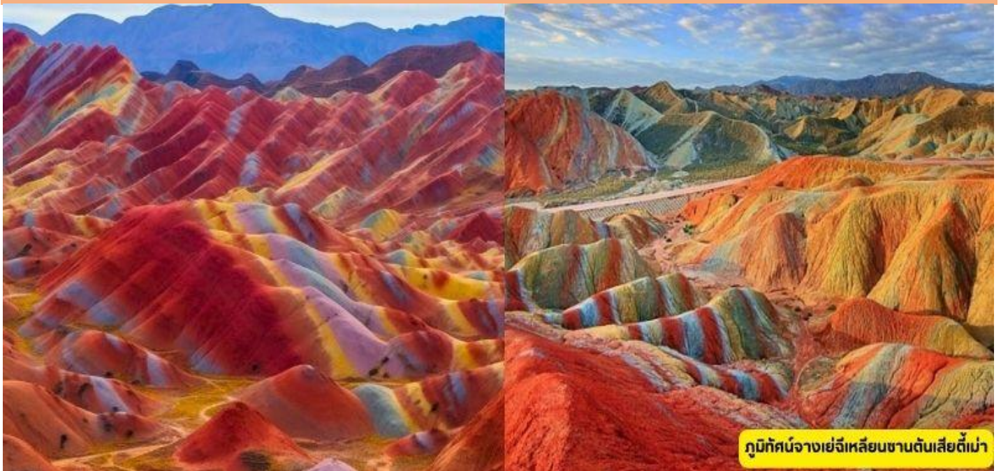
ภูมิตักษั่นจางเย่ฉีเหลียนซานตันเสียดี้เม่า

วันที่สาม เมืองจางเย่ — ภูมิตักษั่นจางเย่ฉีเหลียนซานตันเสียดี้เม่า - เมืองเจียอี้กวน