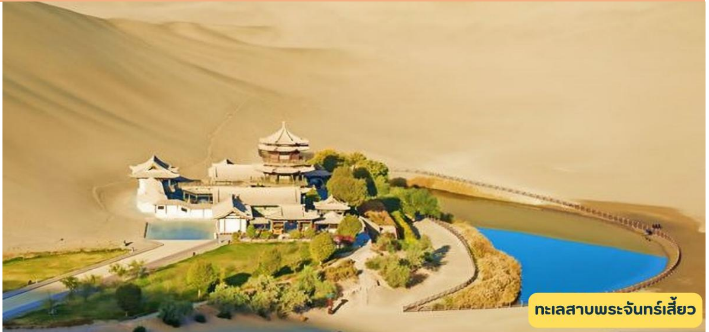
ทะเลสาบพระจันทร์เสี้ยว

วันที่สี่ เมืองเจียก๊วน - จัตุรัสป้อมปราการ - ตุนหวง - หมิงซาซาน - ทะเลสาบพระจันทร์เสี้ยว