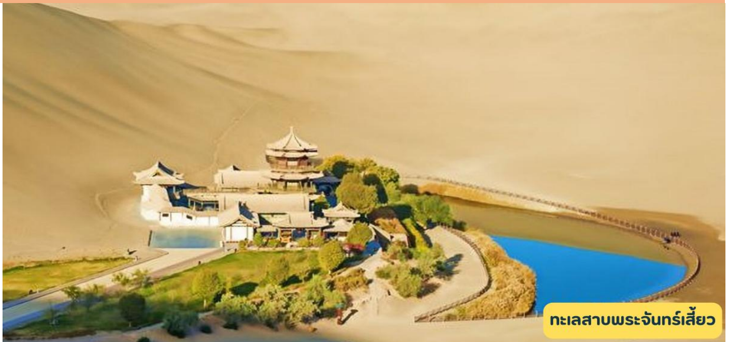
ทะเลสาบพระจันทร์เสี้ยว

วันที่ 1 เมืองเจียก๊ว - จัตุรัสป้อมปราการ - ตุนหวง - หมิงซาซาน - ทะเลสาบพระจันทร์เสี้ยว