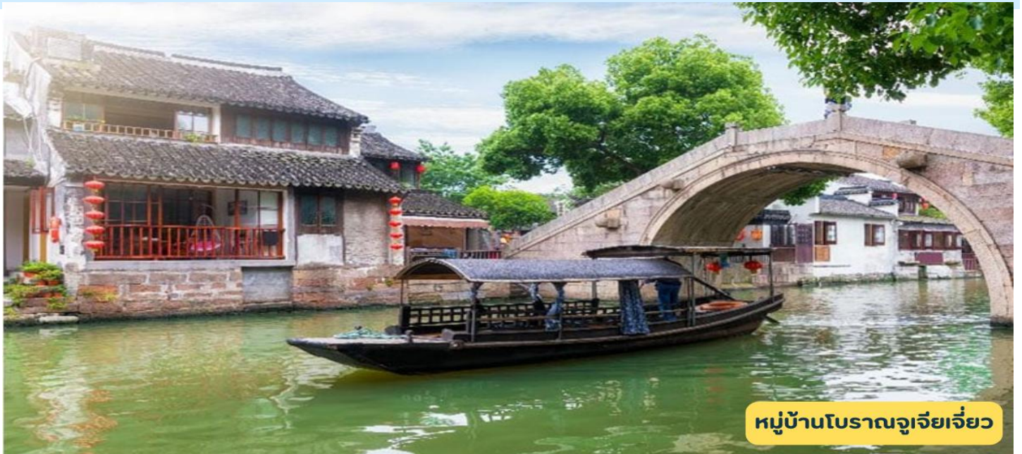
หมู่บ้านโบราณจูเจียเจียว