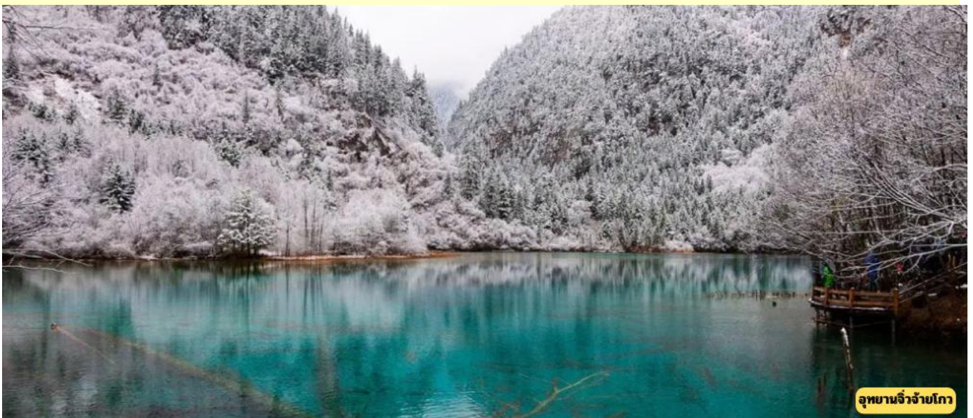
อุทยานจิ่วจ้ายโกว

วันที่สี่ อุทยานจิ่วจ้ายโกว (รวมรถเหมาอุทยาน)