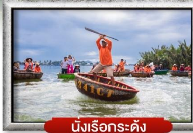
นึ่งเรือกระด้าง