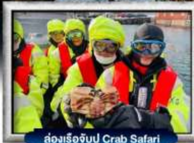
ล่องเรือจับปู Crab Safari