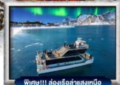
พิเศษ!!! ล่องเรือลำแสงเหนือ

บินทรู สายการบิน Full Service | พิเศษ! บุฟเฟต์ซีฟู้ด