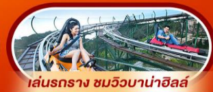
เล่นรางง ชมวิวบานาฮิลล์