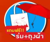
แถมฟรี!! รับ+ถุงผ้า