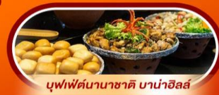
บุฟเฟ่ต์นานาชาติ บานาฮิลล์

พักบน บานาฮิลล์ 1 คืน นั่งกระเช้าที่ยาวที่สุดในโลก ขึ้นสู่บานาฮิลล์ ชมเมือง ฮอยอัน เมืองมรดกโลกที่สวยงามและเจียบสงบ พิเศษ!! บุฟเฟ่ต์นานาชาติ บานาฮิลล์