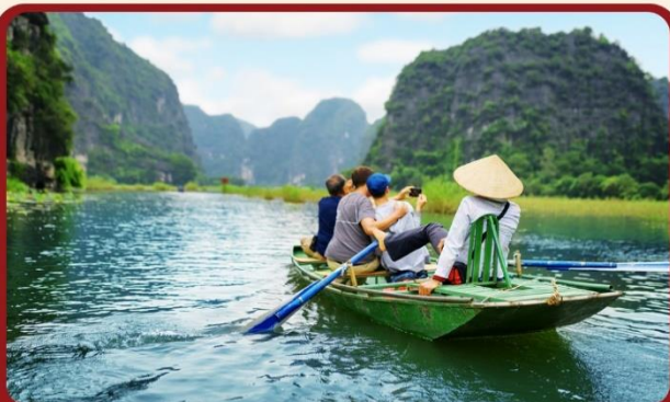
ล่องเรือตามก๊ิก ชมวิวทิวทัศน์แห่งเวียดนาม