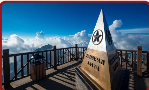
นั่งกระเช้าสู่ยอดเขาฟานซีปัน

พิเศษ !!! SEAFOOD บนเรือสโตร์เวียดนาม + ซาบูหม้อไฟปลาซมออน+ไวน์แดงคาลัด