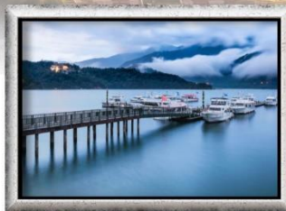
ทะเลสาบสุริยจันทรา