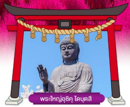
พระใหญ่อุซึคุ ไดบุตสึ