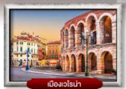
เมืองเวโรน่า

เมนู พิเศษ! สปาเกตตี้เส้นหมึกดำ, พิชซ่าสโตร์อิตาเลียนแท้ 8 วัน 6 คืน อาหาร : 16 มื้อ