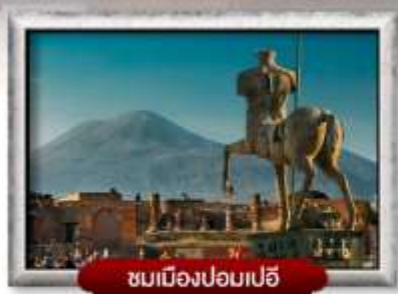
ชมเมืองปอมเปอี