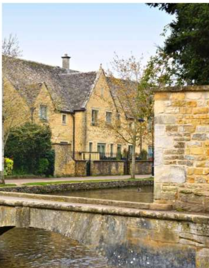
หมู่บ้านเบอร์ตันออนเดอะวอเตอร์

จากนั้นนำท่านเดินทางสู่ เขตคอตส์วอลส์ เขตหมู่บ้านชนบทแสนสวยของอังกฤษถึง 70 หมู่บ้าน ใช้เวลาเดินทางประมาณ 3.30 ชั่วโมง นำท่านเที่ยวชม หมู่บ้านเบอร์ตันออนเดอะวอเตอร์ ( Bourton On The Water ) หมู่บ้านเล็ก ๆ ที่รู้จักกันในนามของ “เวนิส แห่งคอตวอลส์” เมืองที่โด่งดังที่สุดในคอตส์วอลส์ ดูเจียบบงบมีลำธารสายเล็ก ๆ (แม่น้ำวินด์ริช) ไหลผ่านกลางเมือง และมีสะพานหินทอดข้ามน้ำเป็นช่วง ๆ กับต้นวิลโลว์ที่แกว่งกิ่งก้านใบอยู่ริมน้ำ