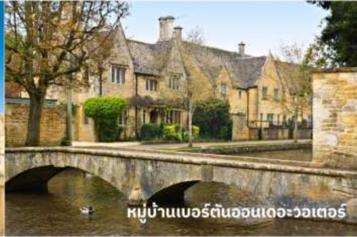
หมู่บ้านเบอร์ตันออนเดอะวอเตอร์