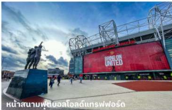
หน้าสนามฟุตบอลโอลด์แทรฟฟอร์ด