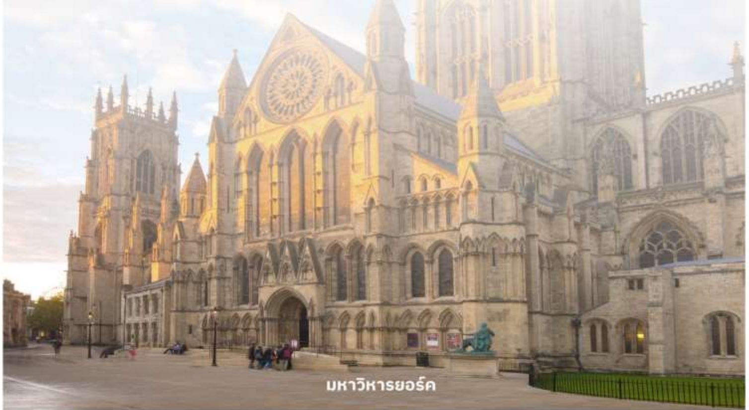
มหาวิหารยอร์ก

จากนั้นนำท่านเดินทางต่อไปที่ The Shambles (เดอะแชมเบิล) เป็นสถานที่ที่มีความคล้ายกับตรอกไดอากอนในภาพยนตร์ชื่อดังอย่าง Harry Potter อีสาระให้ท่านเดินเลือกซื้อของที่ระลึกตามอัธยาศัย