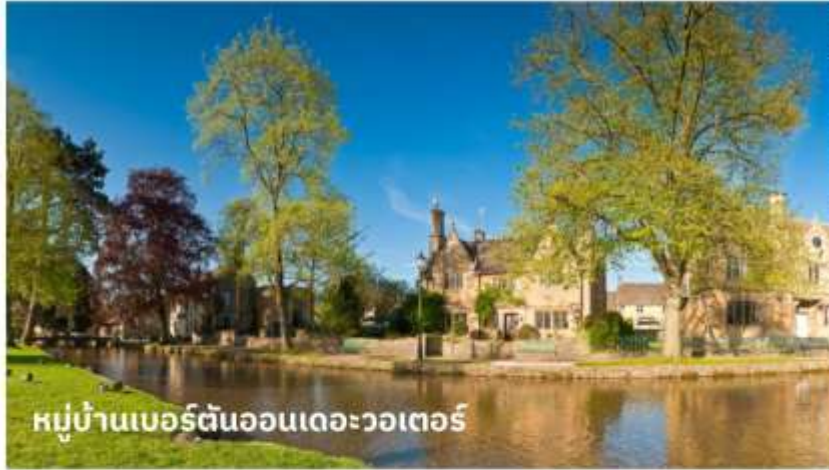
หมู่บ้านเบอร์ตันออนเดอะวอเตอร์