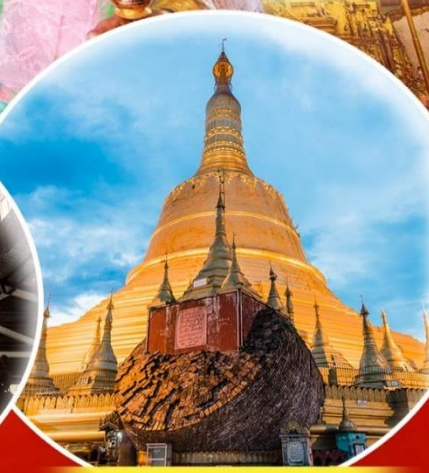
พระธาตุมูเตา

สักการะ 9 สิ่งศักดิ์สิทธิ์ ที่ต้องห้ามพลาด