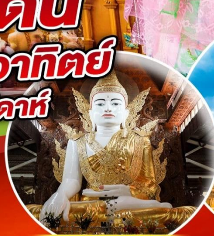
พระหงาทัดจี