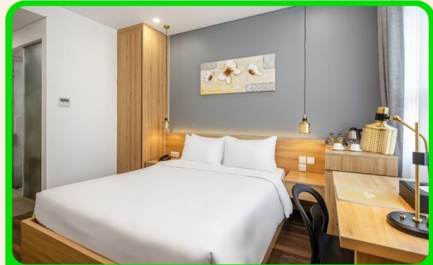
พักเมืองดานัง 4 ดาว 3 คืน