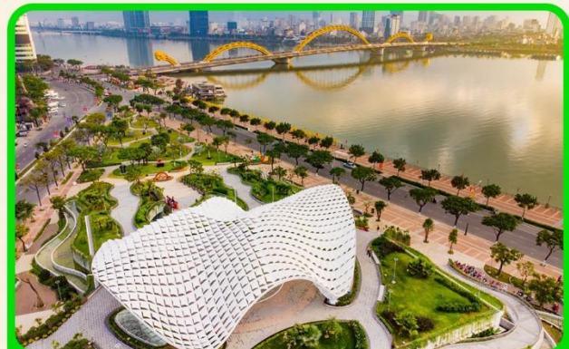
เช็คอิน แหล่งที่เที่ยงใหม่ APEC PARK