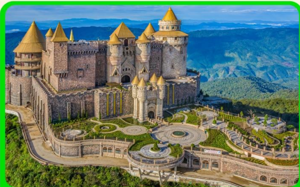
เที่ยวบานาฮิลล์แบบจุใจ เต็มวัน