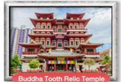
Buddha Tooth Relic Temple