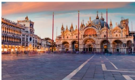
มหาวิหารเซ็นต์มาร์ก