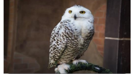
ชมนกฮูกหิมะ (นกฮูกวิกแอร์พอดเตอร์)