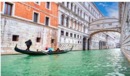
สะพานถอนหายใจ