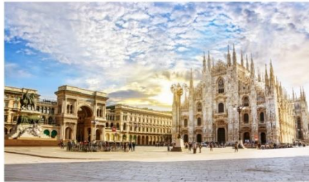
เมืองมิลาน