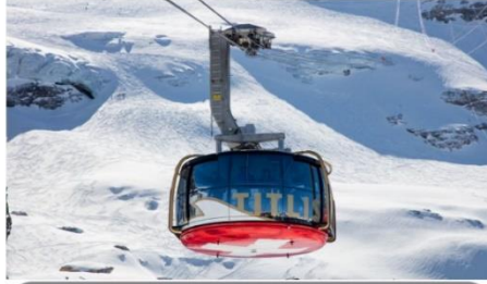
ยอดเกทิตส์