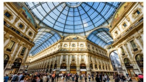
Galleria Vittorio Emanuele II