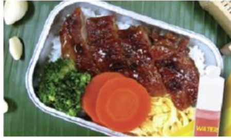
Chicken teriyaki with rice and water