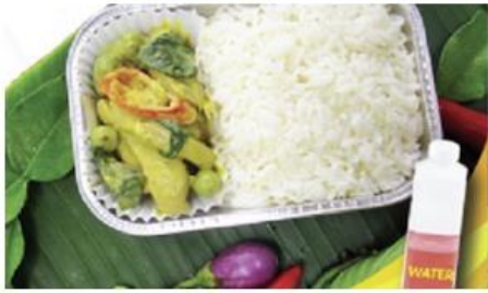
Green curry chicken with rice and water