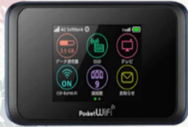
POCKET WIFI สำหรับนำใบใช้ที่ประเทศญี่ปุ่น