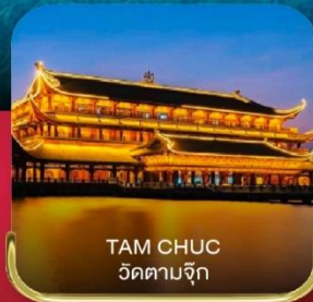
TAM CHUC วัดตามจุก