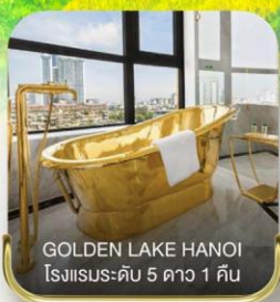
GOLDEN LAKE HANOI โรงแรมระดับ 5 ดาว 1 คืน