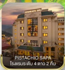
PISTACHIO SAPA โรงแรมระดับ 4 ดาว 2 คืน