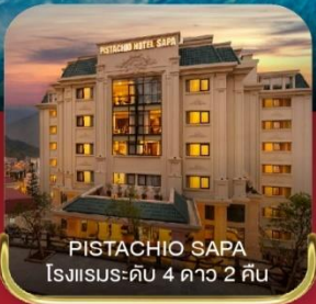
PISTACHIO SAPA โรงแรมระดับ 4 ดาว 2 คืน