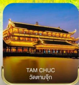
TAM CHUC วัดตามจิก