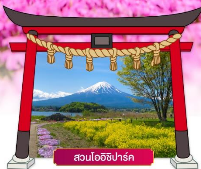
สวนโออิชิปาร์ค