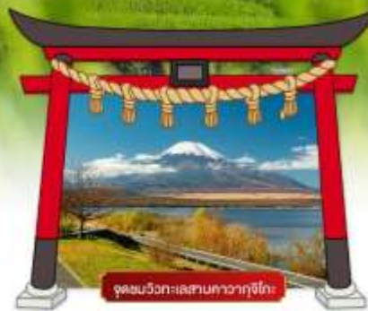
จุดชมวิวกะแสนาคาวากุจิโกะ