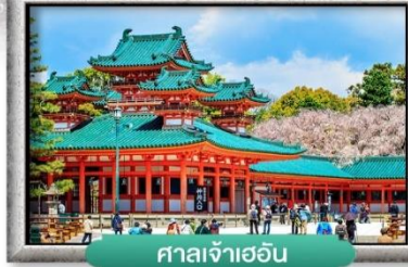
ศาลเจ้าเฮอัน