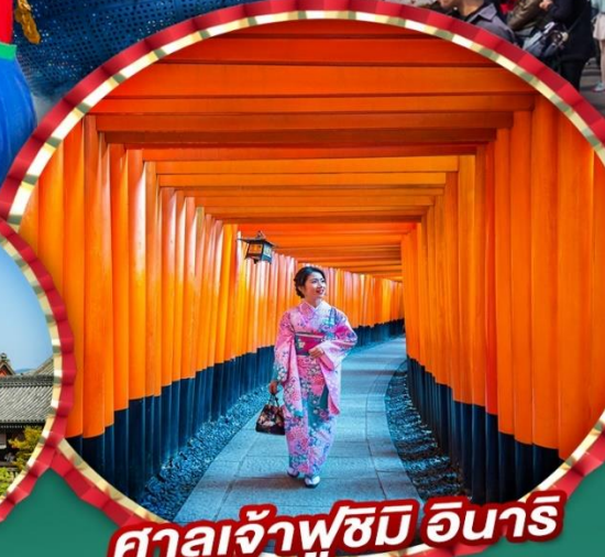
ศาลเจ้าฟุชิมิ อินาริ