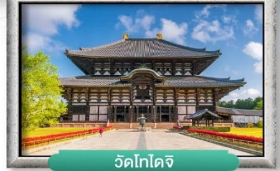
วัดโทไดจิ