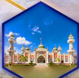
มัสยิดกลางปัตตานี