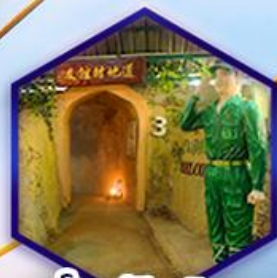
อุโมงค์ปิยะมิตร