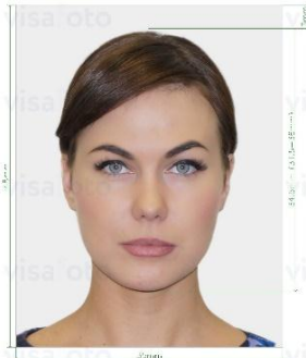
คุณสมบัติรูปถ่าย