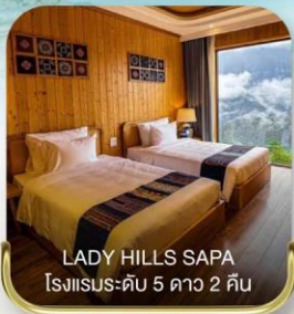
LADY HILLS SAPA โรงแรมระดับ 5 ดาว 2 คืน