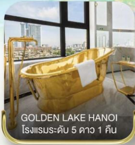
GOLDEN LAKE HANOI โรงแรมระดับ 5 ดาว 1 คืน