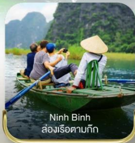
Ninh Binh ล่องเรือตามกีก