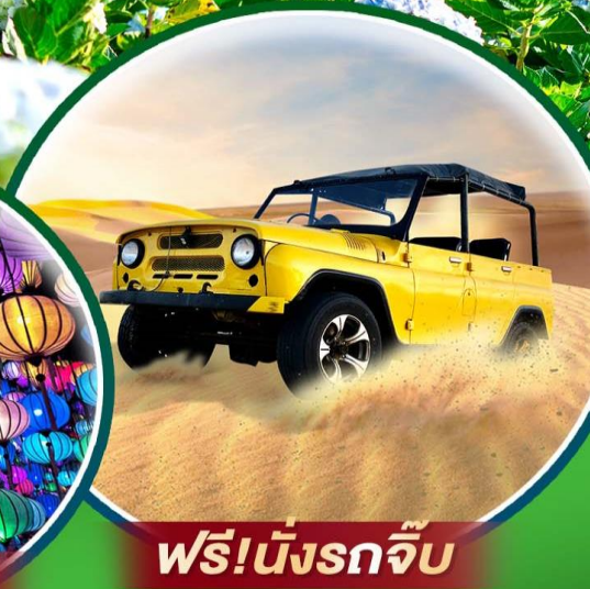
ฟรี! นั่งรถจี๊ป