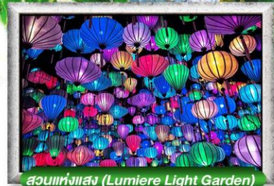
สวนแห่งแสง (Lumiere Light Garden)

เมนู สุดพิเศษ อร่อยไปกับ BBQ / ซิมวอน์แดงดาลัด