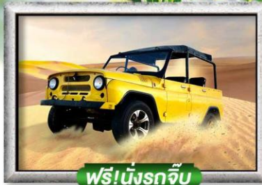
ฟรี!นั่งรถจี๊ป