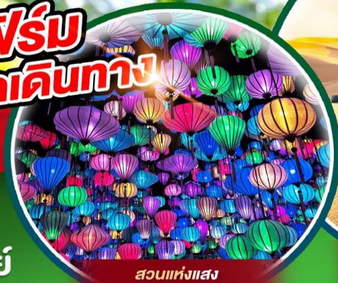
สวนแห่งแสง (Lumiere Light Garden)