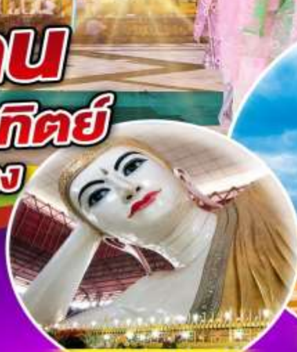
พระนอนคาหวาน