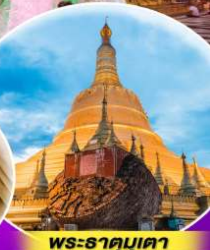
พระธาตุมูเตา

สักการะ สิ่งศักดิ์สิทธิ์ ที่ต้องห้ามพลาด