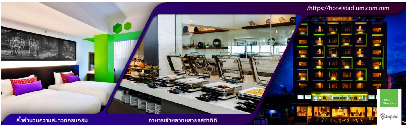
สิ่งแวดล้อมความสะดวกครบครัน

👉 นำท่านเข้าพักที่ HOTEL STADIUM YANGON ระดับ 3 ดาว