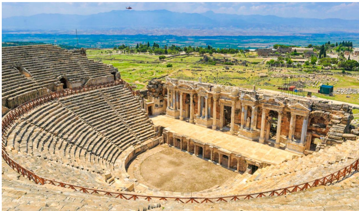
จากนั้นนำท่านชม ปราสาทปุยฝ้าย (Cotton Castle)