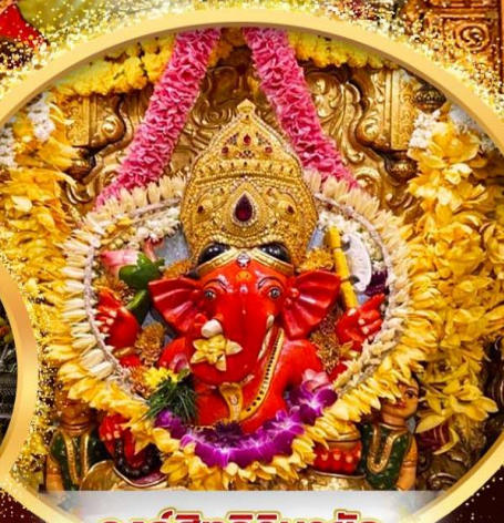
องค์สิทธินายก