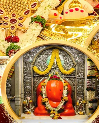
องค์อชฏวินายก