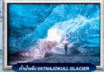
ถ้ำน้ำแข็ง VATNAJOKULL GLACIER

บินทรู สายการบิน Full Service | พิเศษ! ทานอาหารโดมกร-จกวีว 360 องศา