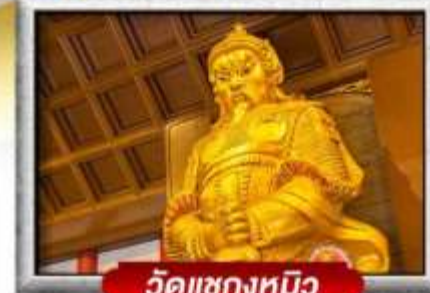
วัดเขกงหมิว