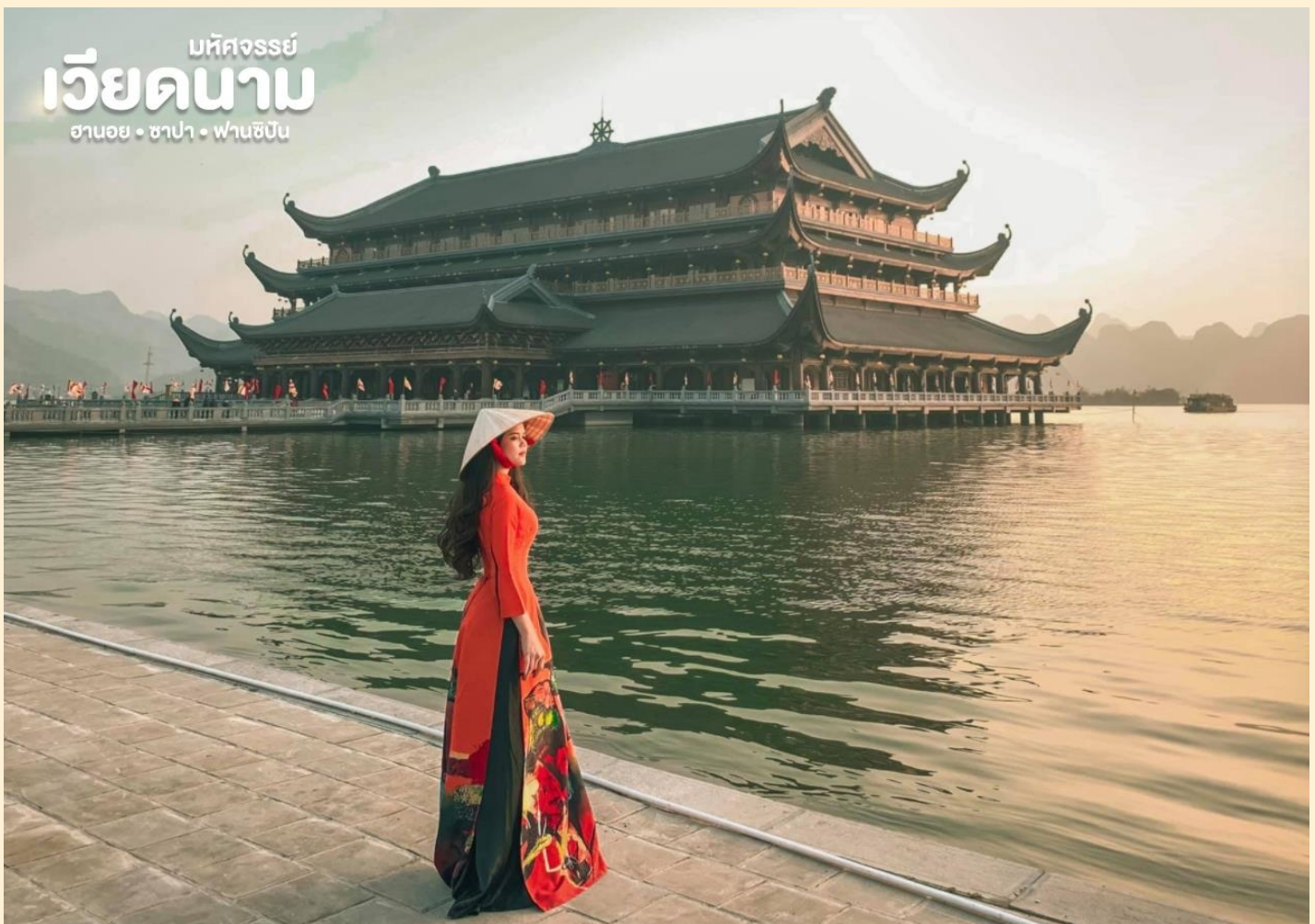
มหิตจรรย์ เวียดนาม ฮานอย • ซาปา • ฟานซิง