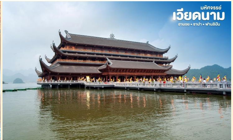
มหิตจรรย์ เวียดนาม ฮานอย • ซาปา • ฟานซิง