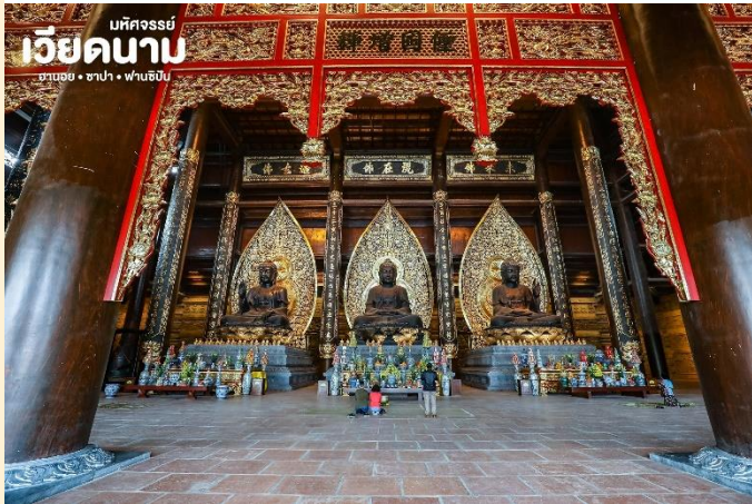
มหิตจรรย์ เวียดนาม ฮานอย • ซาปา • ฟานซิง