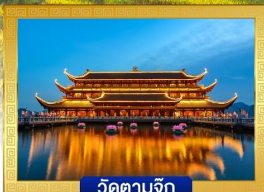
วัดตามจุก