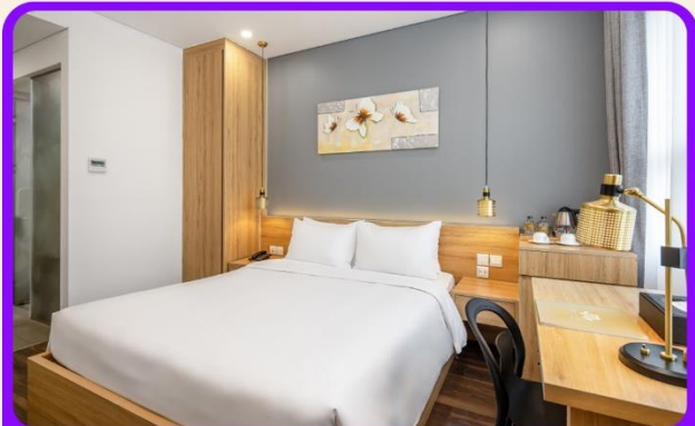
พักเมืองดานัง 4 ดาว 2 คืน