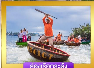
ล่องเรือกระดิง