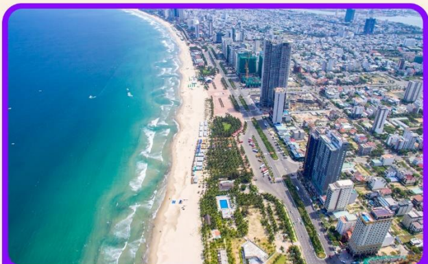
เช็คอิน ชายหาดหมีเคว เป็นชายหาดที่สวยงามที่สุดในเมืองดานัง