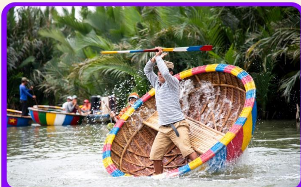
พิเศษ !!! นั่งเรือกระดัง UNSEEN เวียดนาม