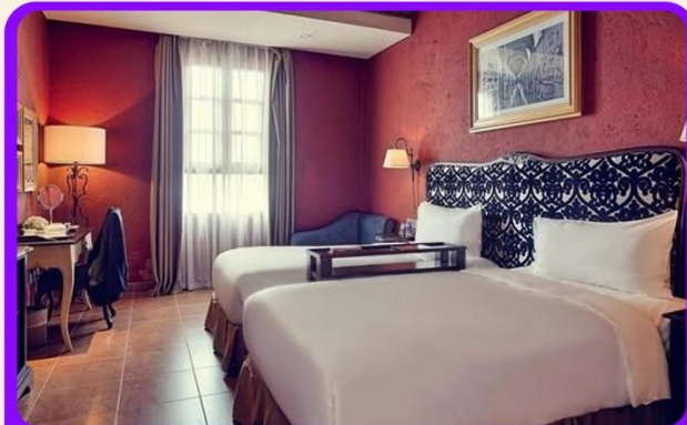
พักบนบานาฮิลล์ 1 คืน