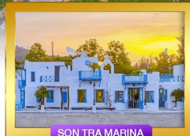
SON TRA MARINA