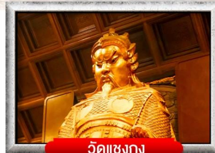
วัดแชงกง