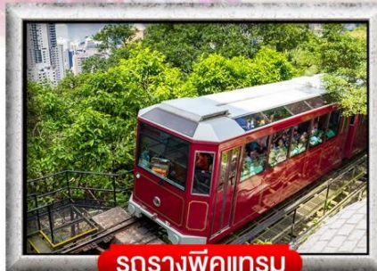
รถรางพิกแครม