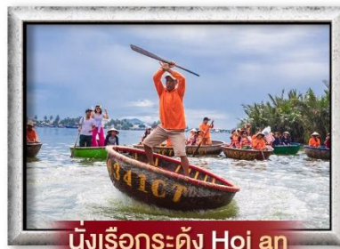
นั่งเรือกระดัง Hoi an