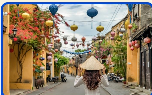
เที่ยวเมืองเก่าฮอยอัน