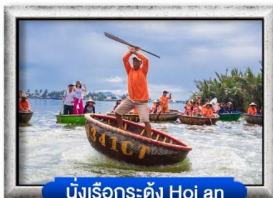
นั่งเรือกระดั่ง Hoi an