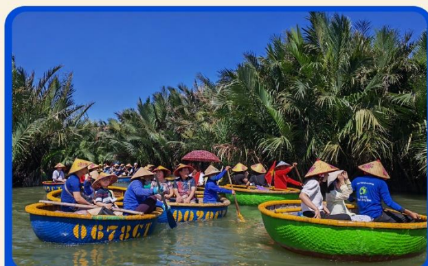
พิเศษ !!! นั่งเรือกระด้ง UNSEEN เวียดนาม