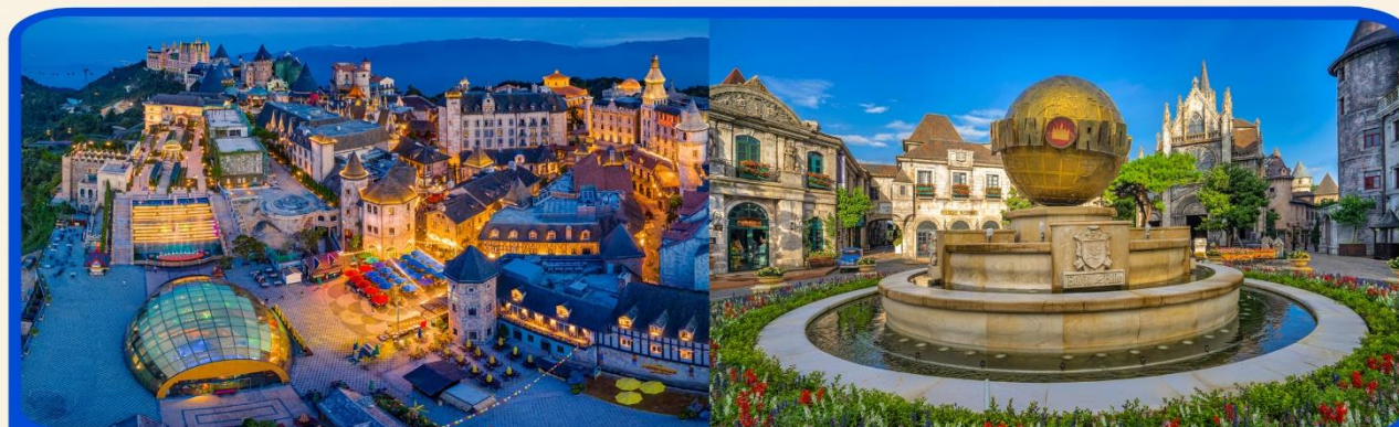
พักบน บานาฮิลล์ 1 คืน