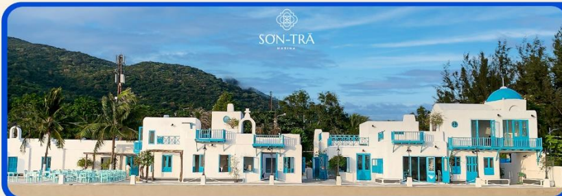
เซ็คอินคาเฟ่ SON TRA MARINA