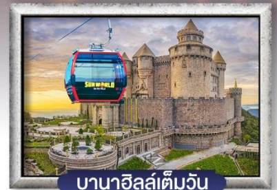
บาน่าฮิลล์เต็มวัน