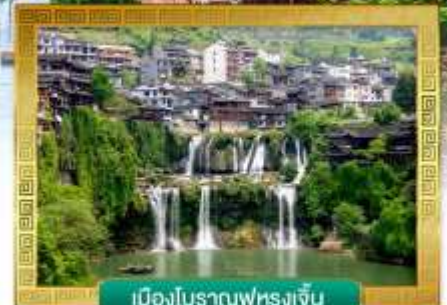
เมืองโบราณฟุ่หลงเจิน