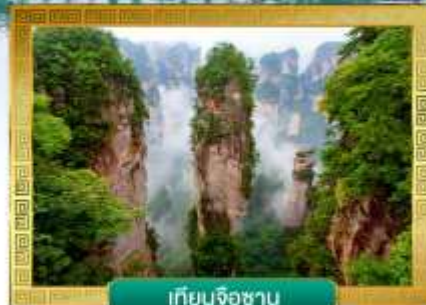
เทียนจื่อซาน

✔ ชมจุดเช็คอินใหม่!! ตึกมหัศจรรย์ 72 ชั้น