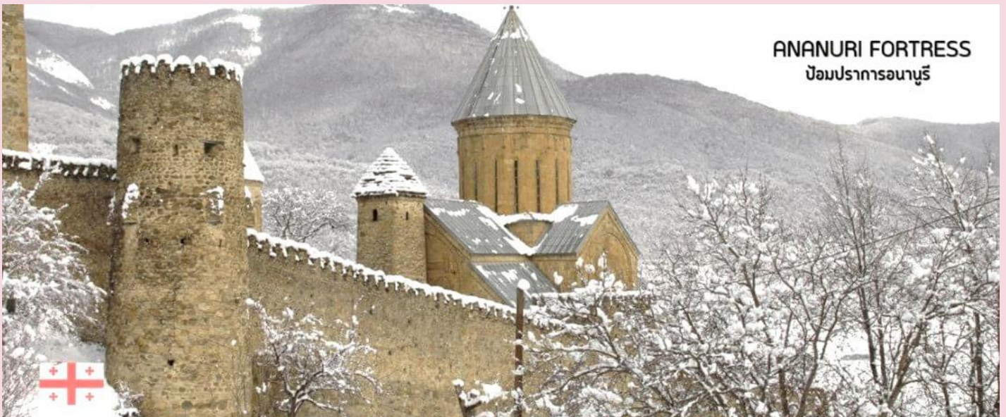
ANANURI FORTRESS ป้อมปราการอนานูรี

นำท่านชม ป้อมอนานานูรี (ANANURI FORTRESS) ป้อมปราการเก่าแก่ ที่มีกำแพงล้อมรอบ ตั้งอยู่ริมแม่น้ำอรั๊กวี สร้างขึ้นในสมัยศตวรรษที่ 16-17 ภายในยังมีโบสถ์ 2 หลังสร้างอย่างงดงามและยังมีหอคอยทรงสี่เหลี่ยมสูงใหญ่ตั้งตระหง่านอยู่ ทำให้เห็นทัศนียภาพทิวทัศน์อันสวยงามด้านล่างจากมุมสูงของป้อมปราการนี้ รวมถึง อ่างเก็บน้ำชินวาลี (ZHINVALI RESERVOIR) และยังมีเขื่อนซึ่งเป็นสถานที่ที่สำคัญสำหรับนำน้ำที่เก็บไว้ส่งต่อไปยังเมืองหลวง พร้อมใช้ผลิตกระแสไฟฟ้า ที่ทำให้ชาวเมืองทบิลีซีมีน้ำไว้ดื่มใช้ (ใช้เวลาเดินทางประมาณ 1.10 ชั่วโมง)